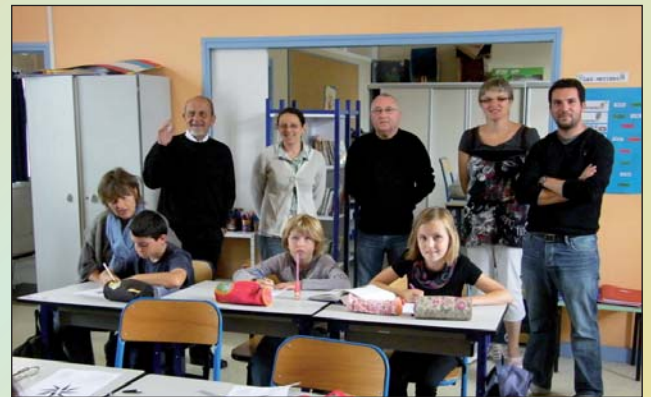
"La rentrée à Charles Perrault (02 98 29 93 55)"