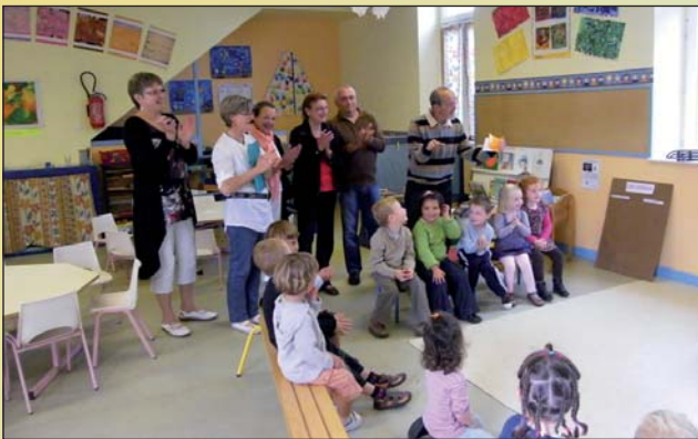
"La rentrée à Sainte-Thérèse (02 98 29 94 69)"